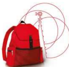
16.-20. Mai 2012 in Mannheim