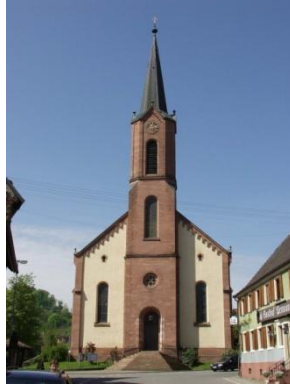
Kirche St. Peter und Paul