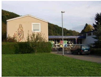
Kindergarten St. Elisabeth