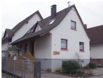
Kindergarten St. Landolin